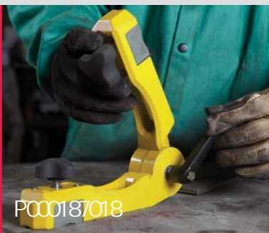
Hoek instelling met één hendel.