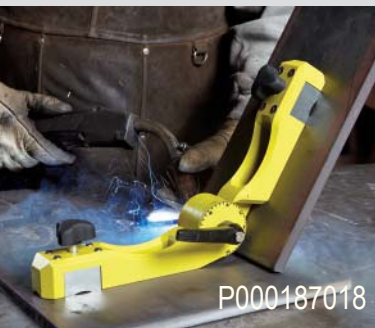
Staploze instelling van de gewenste hoek 22 to 270 graden.