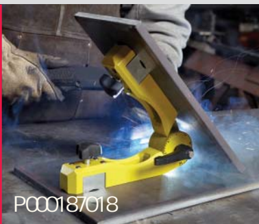
Eén magneet per zijde.

De MAGSWITCH Pivot hoek biedt een scala aan hoeken van 22 tot 270 graden. Elke arm beschikt over een MAGSWITCH met een hechtkracht van 90 kg. Met een enkele hendel op het scharnier stel je traploos je gewenste hoek in. Een goede schaalverdeling zorgt voor een snelle efficiënte instelling. De Pivot hoek is ideaal om snel buizen en vlakke stukken samen te stellen. Ideaal voor serie werk met afwijkende hoeken.