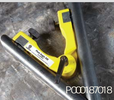
Past voor buizen en vlakke stukken.